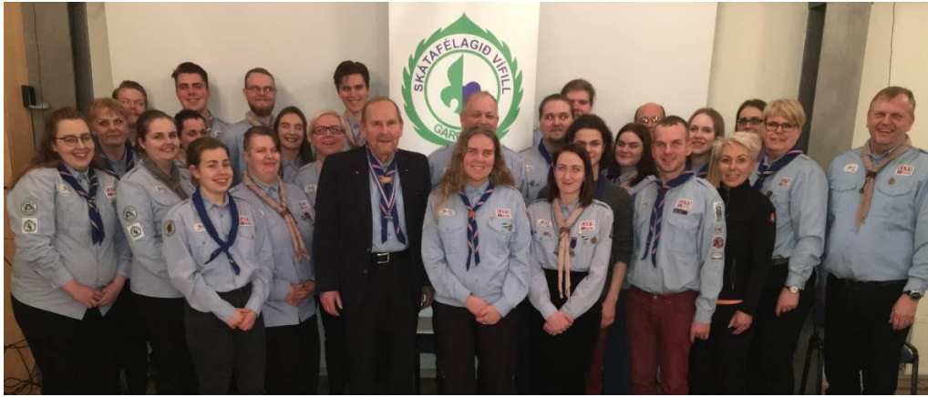
Fundarmenn á aðalfundi 2017