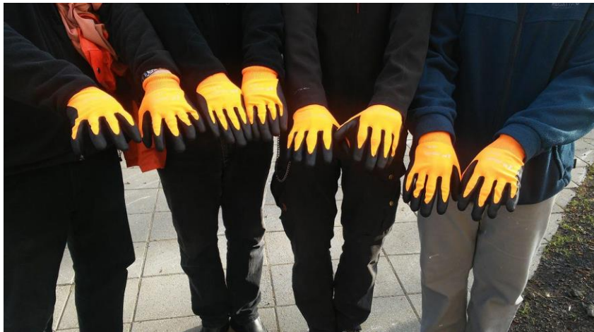
Baklandið ávallt viðbúið

Foringjar og aðstoðarforingjar Vífils eru 13 og á aldrinum 17-52 ára. Skátafélagið reynir eftir megni að huga vel að foringjum, baklandi og stjórn, sem eru einstaklingar sem taka að sér ýmis konar verkefni í sjálfböðavinnu. Vífill hefur m.a. haft það fyrir sið að bjóða virkum aðilum úr þessum hópi foringja og baklands á nokkra viðburði yfir árið sem þakklætisvott fyrir óeigingjarnt starf og til þess að hrista hópinn enn betur saman.