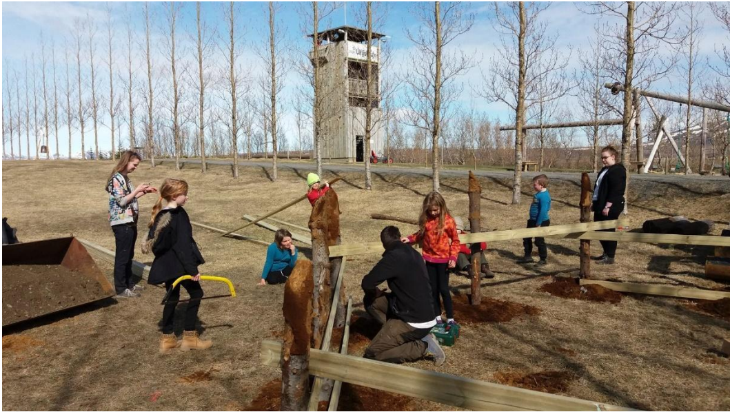
Skátasveit í heimsókn á Úlfjótavatni