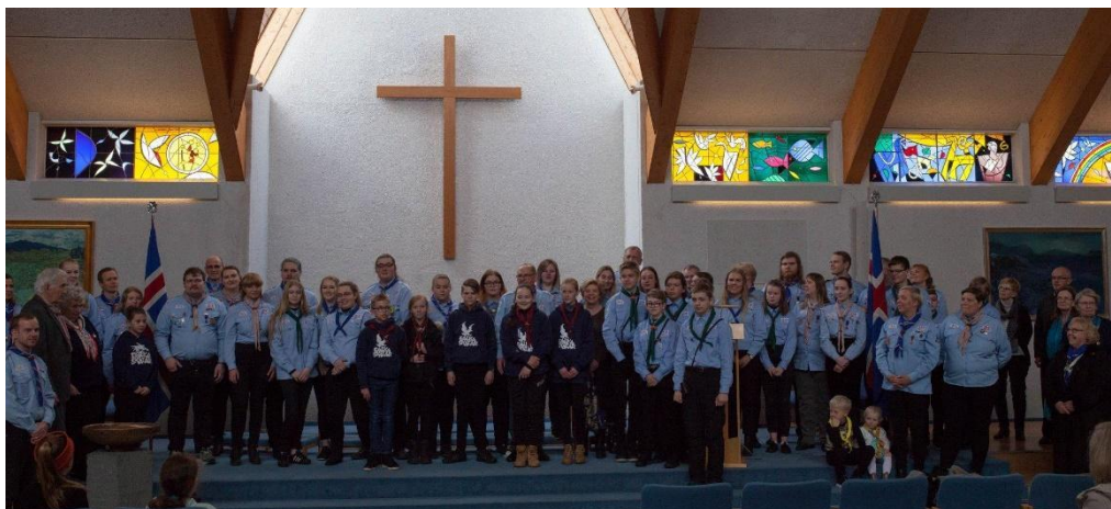
Föngulegur hópur á sumardaginn fyrsta

Skátafélagið Vífill er aðili að Bandalagi íslenskra skáta og starfar skv. meginmarkmiði skátahreyfingarinnar að því að þroska börn og ungt fólk til að verða sjálfstæðir, virkir, hjálpsamir og ábyrgir einstaklingar í samfélaginu. Rúm 100 ár eru síðan skátastarf hófst í heiminum og nú eru um 30 milljónir skáta starfandi innan vébanda skátahreyfingarinnar í meira en 200 þjóðríkjum. Skátar á Íslandi munu vera tæplega 3000.