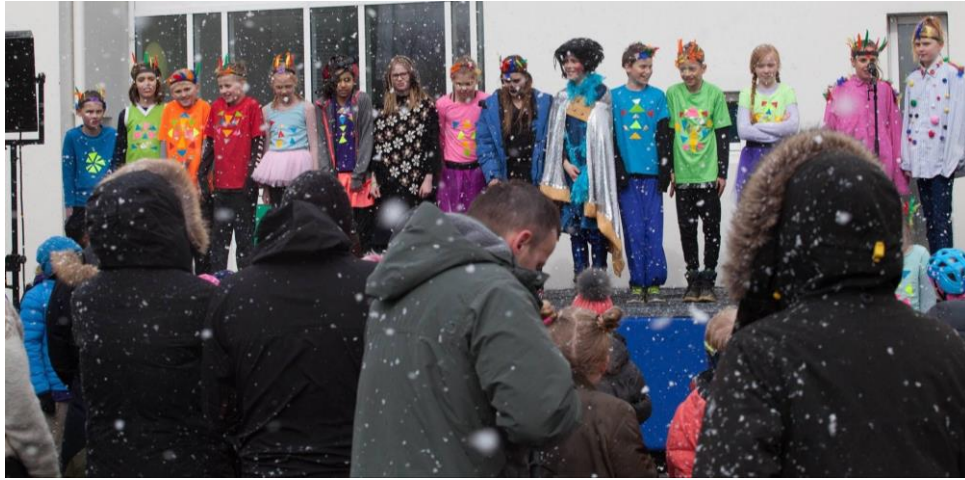
Það blés og snjóaði

fyrir bæjarbúa. Að lokinni dagskrá hjálpuðust skátar að við frágang og í kjölfarið var slegið upp grillveislu þar sem boðið var upp á Binnaborgara.