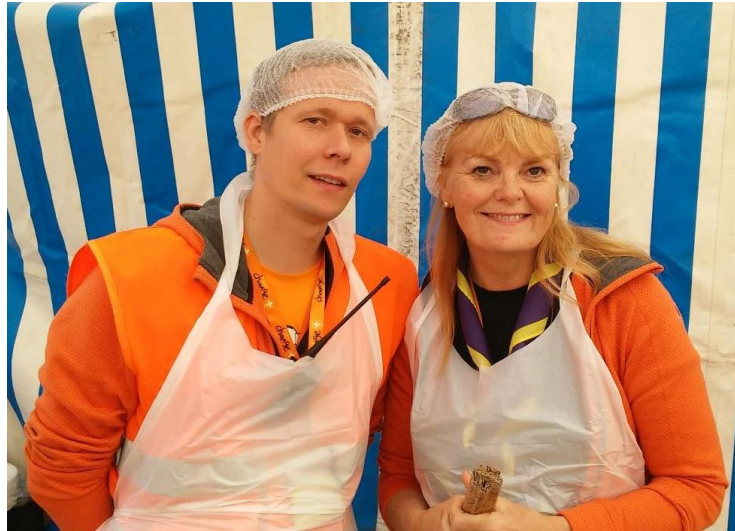
Baklandið vel útbúið

Foringjaráð hittist enn á ný og skipulagði hauststarfið og hélt vinnufund 3. september frá kl. 13.00 - 18.00. Á sama tíma tók baklandið til hendinni innan- og utandyra og fegraði umhverfið eins og hægt væri. Svo var boðið upp á vöfflukaffi fyrir hópinn.