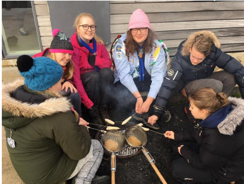
Útiöldun í félagsútilegu