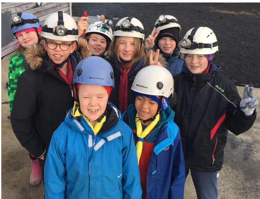
Nýir hjálmur og höfuðljós

Skátafundir hófust í vikunni 11. – 15. september. Ekki var farið í miklar auglýsingar en frétt um að starfið væri að byrja á ný var sett bæði á vefsíðu og facebooksíðu félagsins.