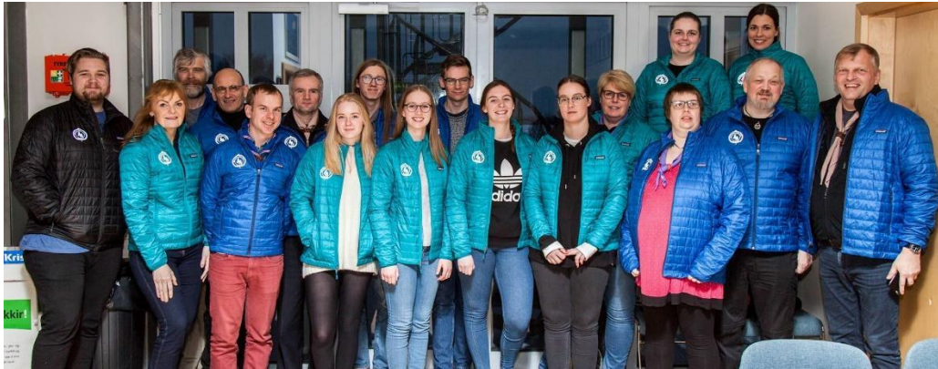
Félagsráð á fundi í janúar 2018