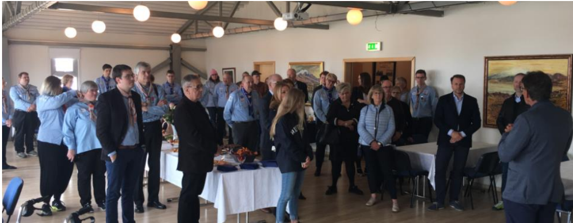
Gestir í afmælisfagnaði í apríl