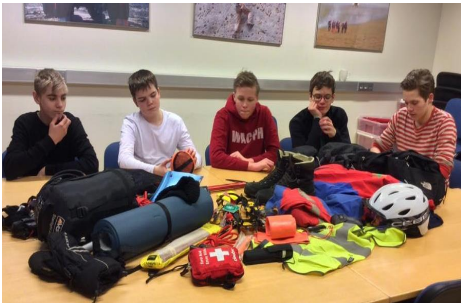
Kynning hjá HSG

Flottur og góður hópur sem að vinnur vel saman og hafa nýjir skátar byrjað og fallið vel inn í hópinn.