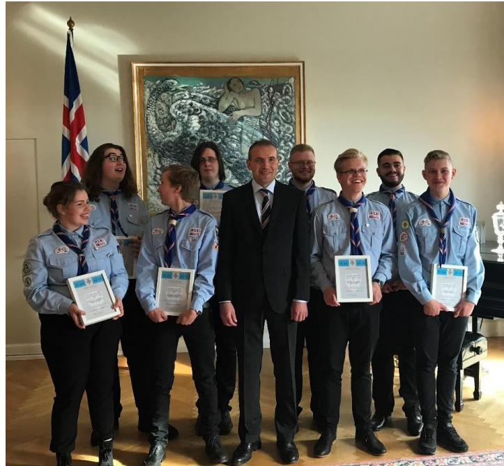
Allir forsetamerkishafar 2017