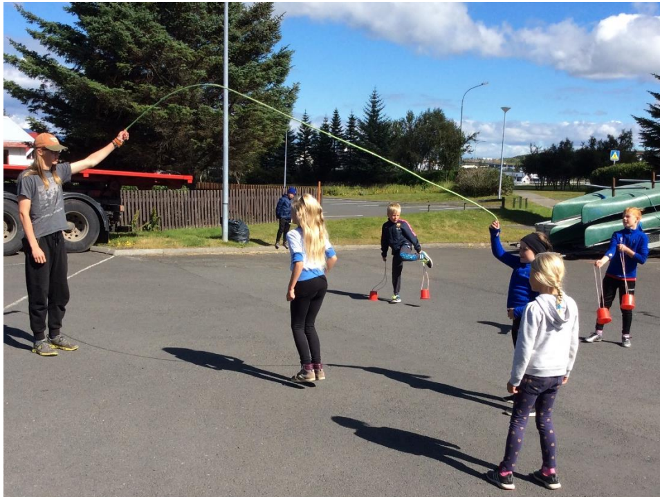
Fjölbreyttir leikir á sumarnámskeiðum