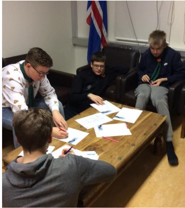
Skipulagsvinna og skátafræði