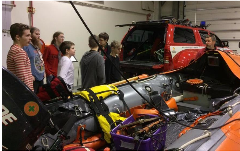
Dróttskátar í heimsókn hjá HSG

Öryggis vegna eru önnur afnot ekki leyfð á meðan á því stendur. Samningur um samstarf HSG og Vífils er varðar skátastarfið sjálft var endurnýjaður síðast árið 2014 og er í endurskoðun í lok ársins 2017.