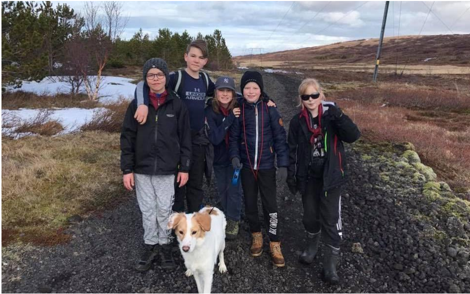
Áskoranir og útilíf